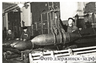
«Всё для фронта, всё для Победы» – под таким девизом жил Дзержинск в 1941-1945 гг.

второму городу региона почётного звания.