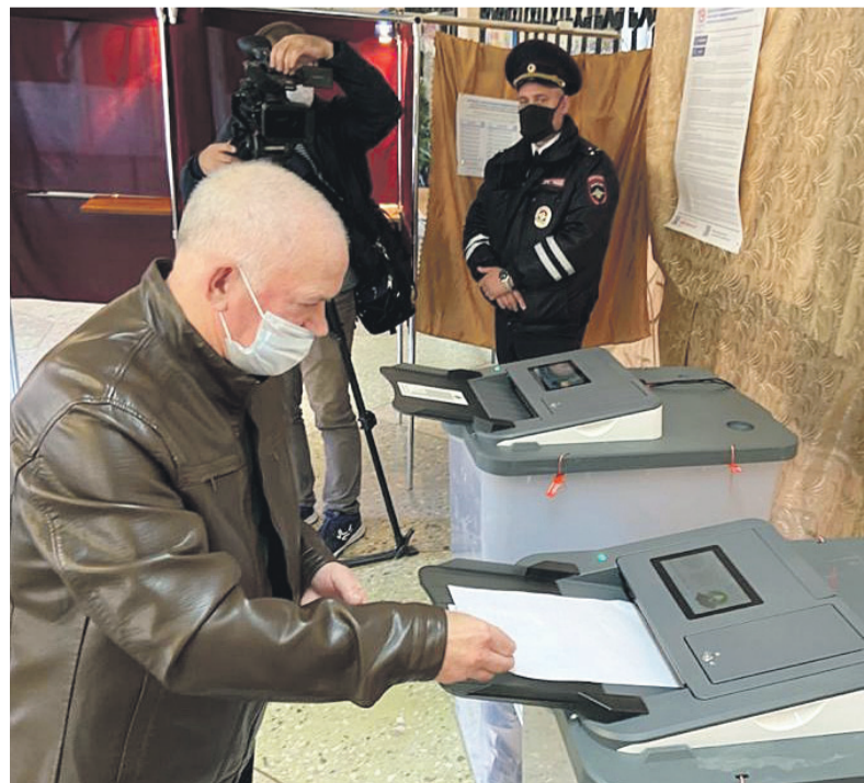
В новом созыве регионального парламента будут представлены пять политических партий.

Многие инициативы были направлены для формирования федеральной народной программы партии и нашли там своё отражение. «Есть такие вопросы, которые возможно решить только на федеральном уровне, – объяснила парламентарий. – Например, часто звучал вопрос о капитальном ремонте наших детских оздоровительных лагерей. Действительно, материальная база износилась. Чтобы начать новую программу инфраструктурных изменений, нам необходима помощь федерации. Это предложение мы также отправили на федеральный уровень. Надеемся, такая программа появится».