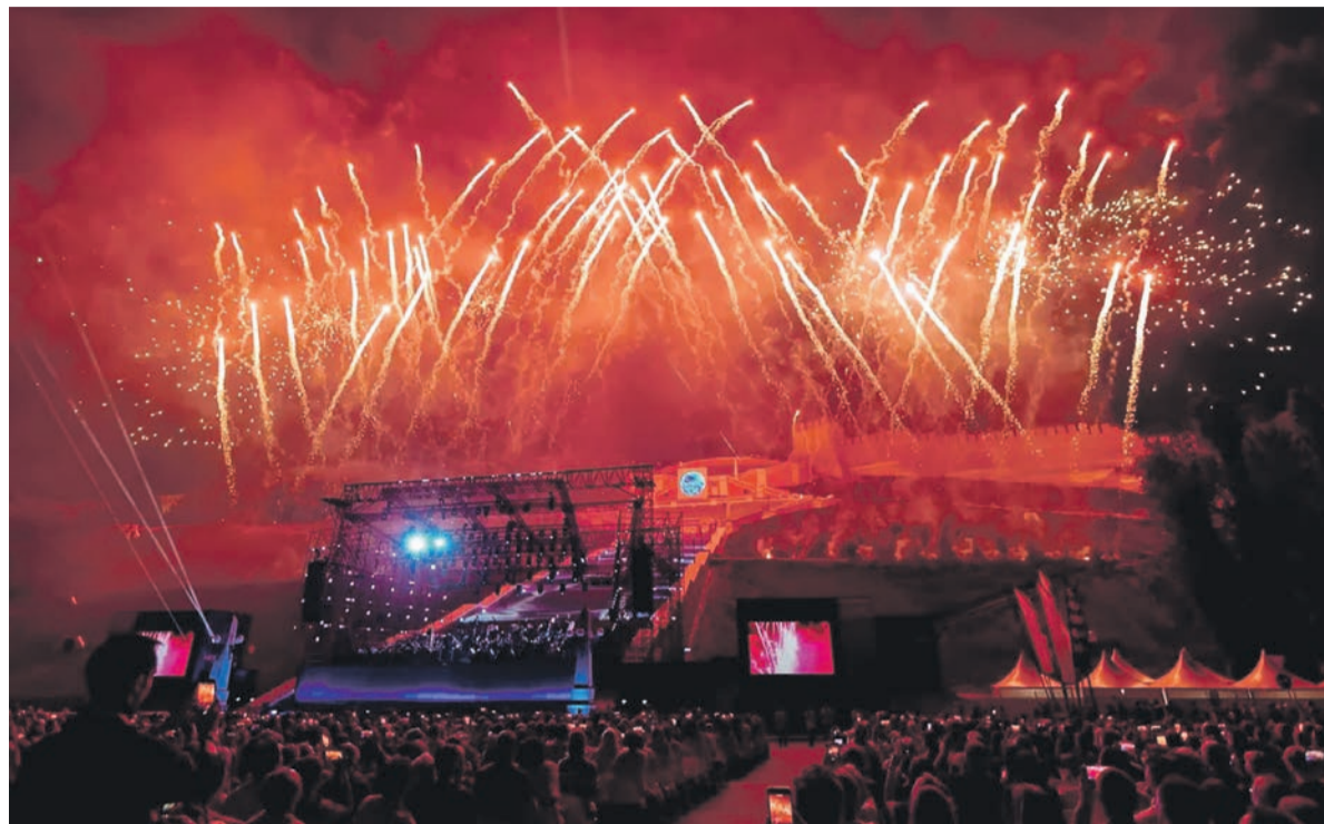
Подготовка Нижнего Новгорода к юбилею – старт важного этапа развития города.

К юбилею в городе шло грандиозное благоустройство общественных пространств: обновили территорию Нижегородской ярмарки, мыс Стрелки и пакагузы, Окскую набережную, Александровский сад, реконструировали Чкаловскую лестницу, здания бывшей фабрики «Маяк». Реновации дождалась набережная Гребного канала и Нижневолжская набережная, площадь Маркина и площадь перед станцией канатной дороги, улица Большая Покровская и сквер им. Свердлова, набережная Федоровского и многие другие объекты. Где-то работы ещё продолжаются.