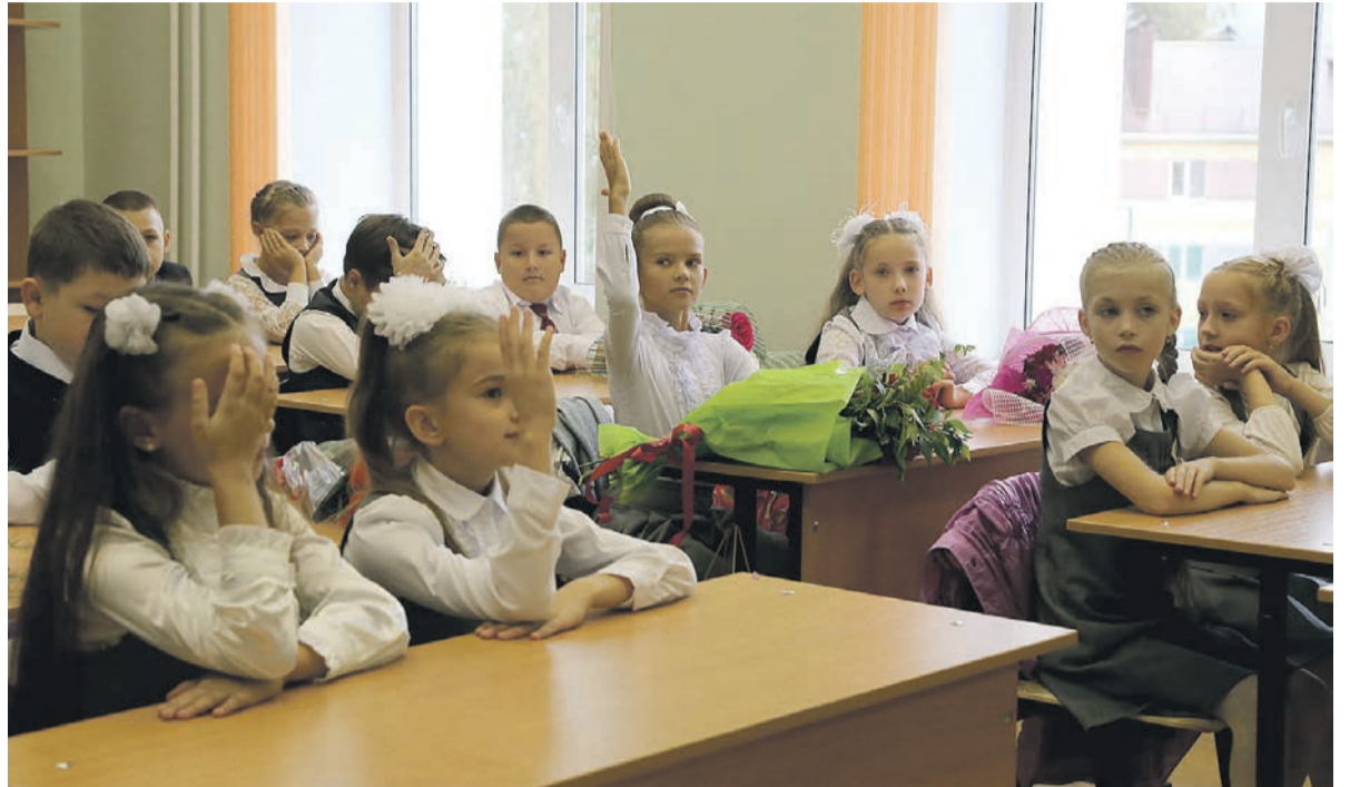
Наши дети должны учиться в комфортабельных обновлённых школах. Многим школьным зданиям нужен капремонт.

Но пока не удалось найти полный перечень школ, где нужен