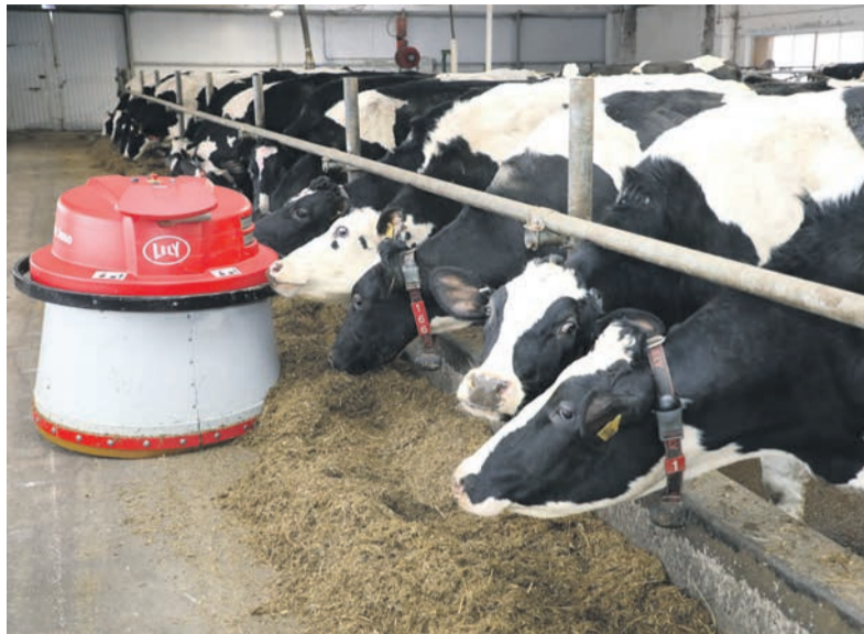
Искусственный интеллект уже доит коров на сельхозпредприятиях региона.

Беспилотники снимают поля в Дивеевском муниципальном