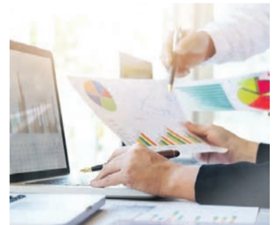
Новые меры господдержки внесут в областные законы.

Комитет также утвердил план совместных действий с Советом