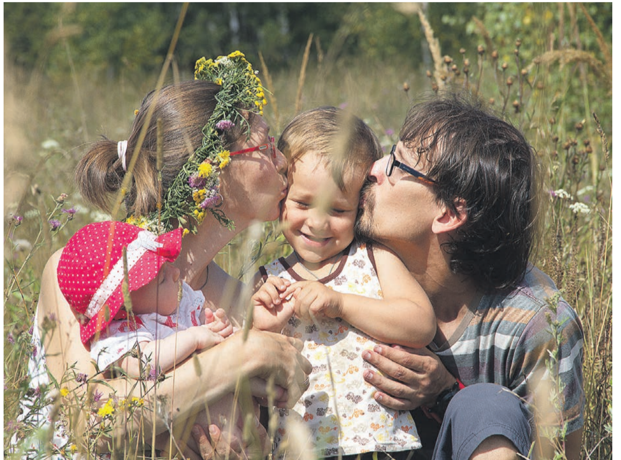
При поддержке государства родители смогут решить многие проблемы.

через полтора года получить единовременно 10 тыс. руб. из 100 тыс. и потратить их по своему усмотрению. Ещё одна поправка предполагает, что таким образом можно будет распорядиться уже 20 тыс. руб. сразу после появления ребёнка на свет.