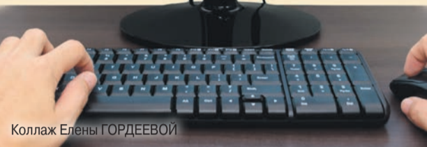
Коллаж Елены ГОРДЕЕВОЙ

А вот как на вопрос о возможностях, создаваемых общероссийской базой вакансий, ответили посетители официального сайта регионального парламента.