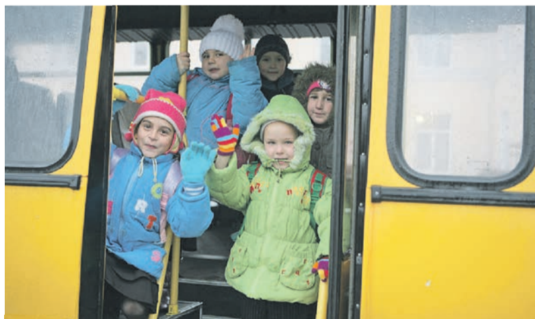
В регионе детей без билета не высаживают, если это угрожает здоровью.