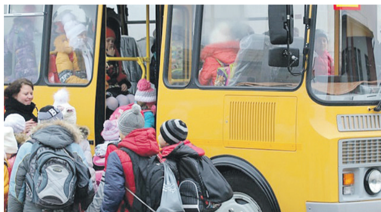
Льготники фактически полностью перейдут на оплату проезда по транспортным картам.