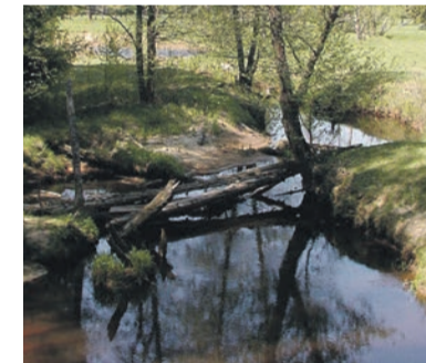
Реки и речушки надо беречь.

Нижегородская область – регион с высокой водообеспеченностью. Он расположен в бассейне Волги, а всего здесь протекают