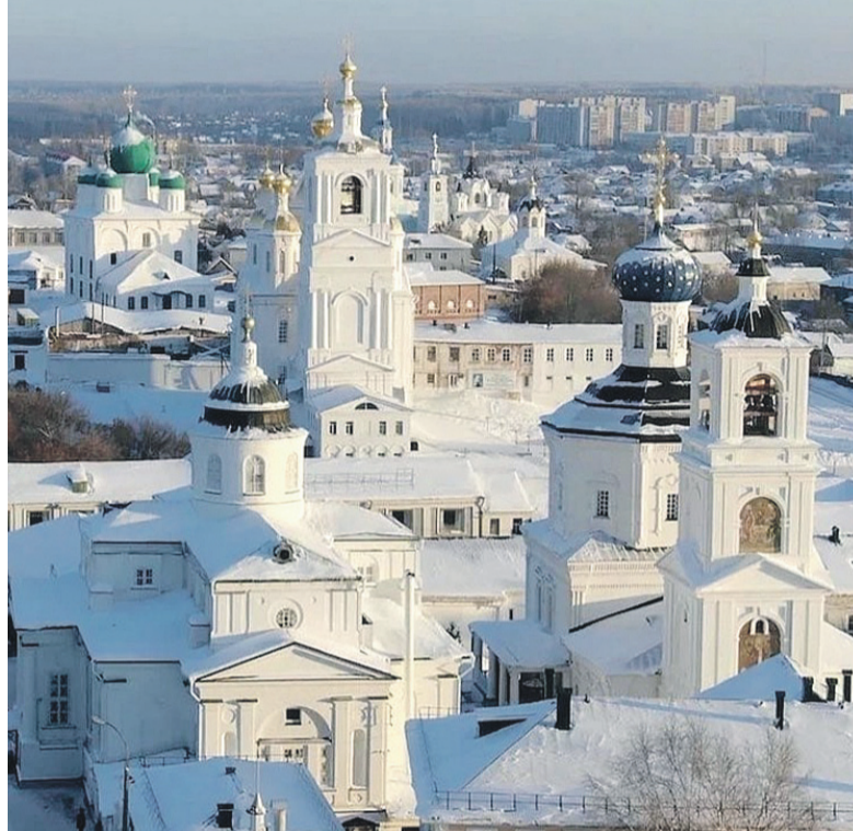
Арзамас - историческое поселение. Важно сделать его ещё одним туристическим центром на карте Нижегородской области.

— Бизнес, в том числе и малый, всегда идёт туда, где люди стабильно и долго готовы потреблять его товары и услуги, — говорит заместитель предсе-