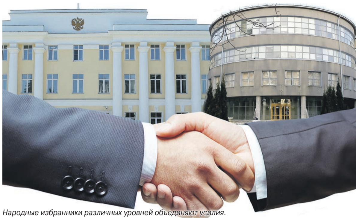
Народные избранники различных уровней объединяют усилия.

Областной и городской парламент обсудили, как обновляется город