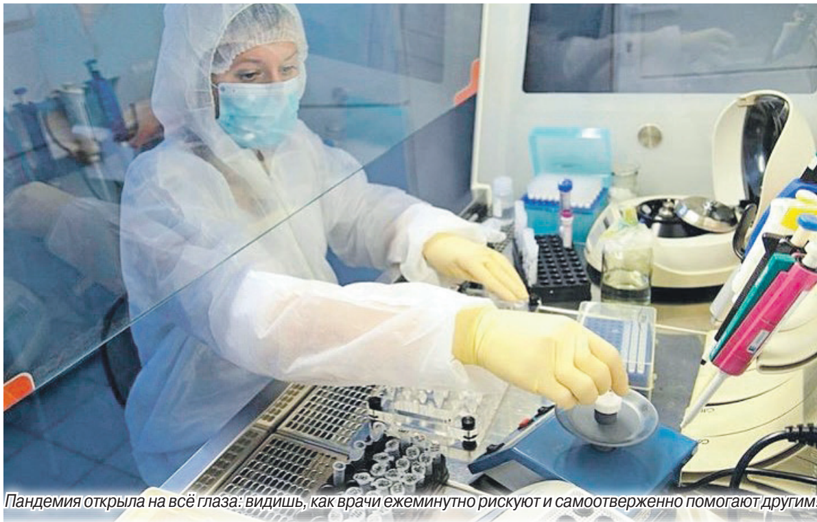
Пандемия открыла на все глаза: видишь, как врачи ежеминутно рискуют и самоотверженно помогают другим!

— Мой избирательный округ — это Сокольское, Городец, Заволжье, Чкаловск. Мы посещали больницы во всех этих населённых пунктах. Помогали как могли. Понятно, что у меня нет медицинского образования... Поэтому принимал граждан, обсуждали вопросы, разбирались,