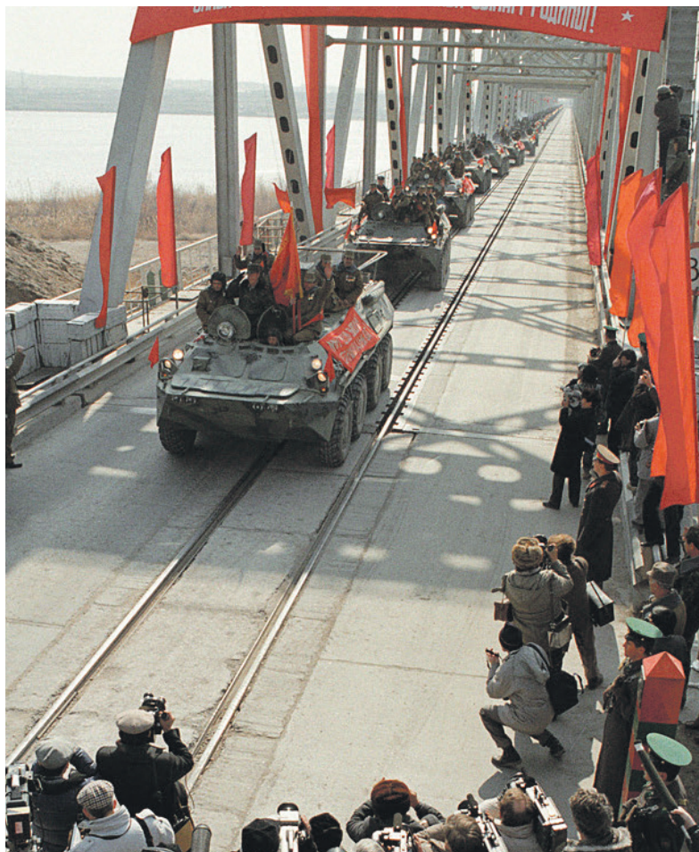
Более 6,5 тыс. нижегородцев выполняли интернациональный долг в Афганистане. На фото: последняя колонна советских войск пересекает афгано-советскую границу, 15 февраля 1989 года.

завершилась десятилетняя война, унёсшая жизни почти 14 тыс. наших соотечественников. Более 6,5 тыс. нижегородцев выполняли интернациональный долг в Афганистане. Свыше 3 тыс. из них награждены орденами и медалями.